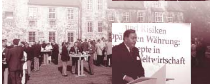
„Chancen und Risiken einer europäischen Währung“ standen im Mai '96 im Mittelpunkt einer Zustifterveranstaltung mit Hilmar Kopper, dem damaligen Vorstandssprecher der Deutschen Bank.