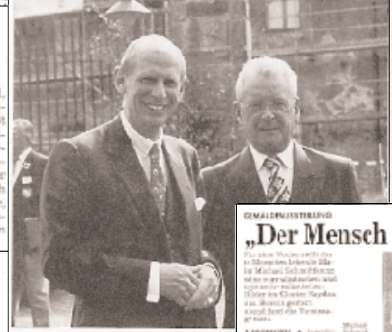
Stihl (links) und Stihl (rechts)